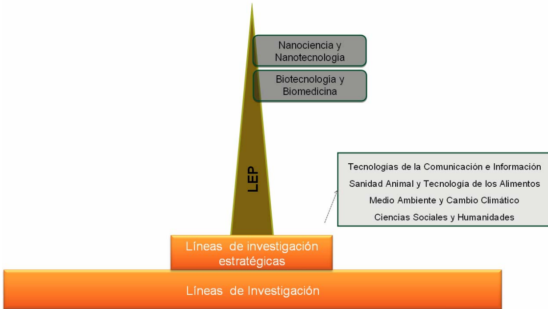
Esquema de las líneas estratégicas prioritarias de la UAB.

El proyecto UAB CEI cuenta con la adhesión de un total de 77 instituciones, entre las que podemos encontrar al gobierno autonómico (Generalitat de Catalunya), 44 centros e institutos de investigación con personalidad jurídica propia, 21 empresas y parques empresariales, 2 organismos públicos de I+D y 9 ayuntamientos. La relación detallada se puede consultar en la página web: http://www.uab.es/uab-cei/agregaciones/